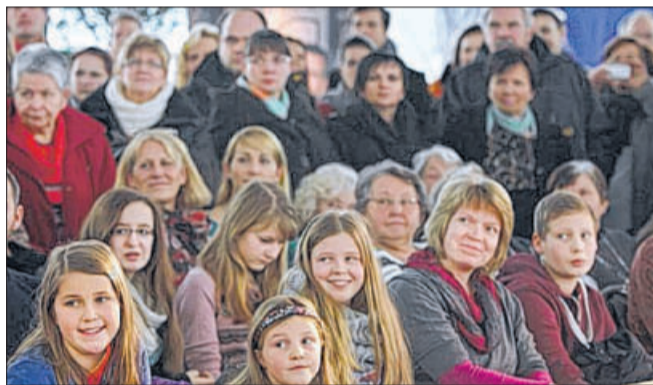
Das Publikum staunt und träumt beim Anblick der Brautmode.