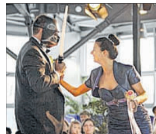
Ausgefallene Show mit Laserschwert und Maske.