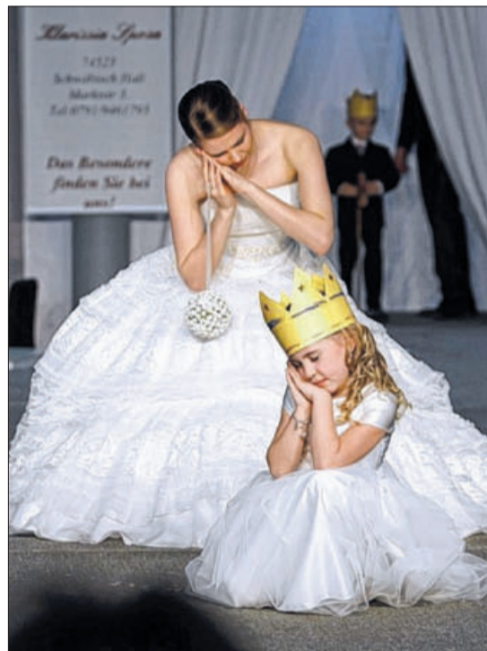
Bei der Schau wirken auch junge Models mit – ebenfalls in edlen Kleidern.