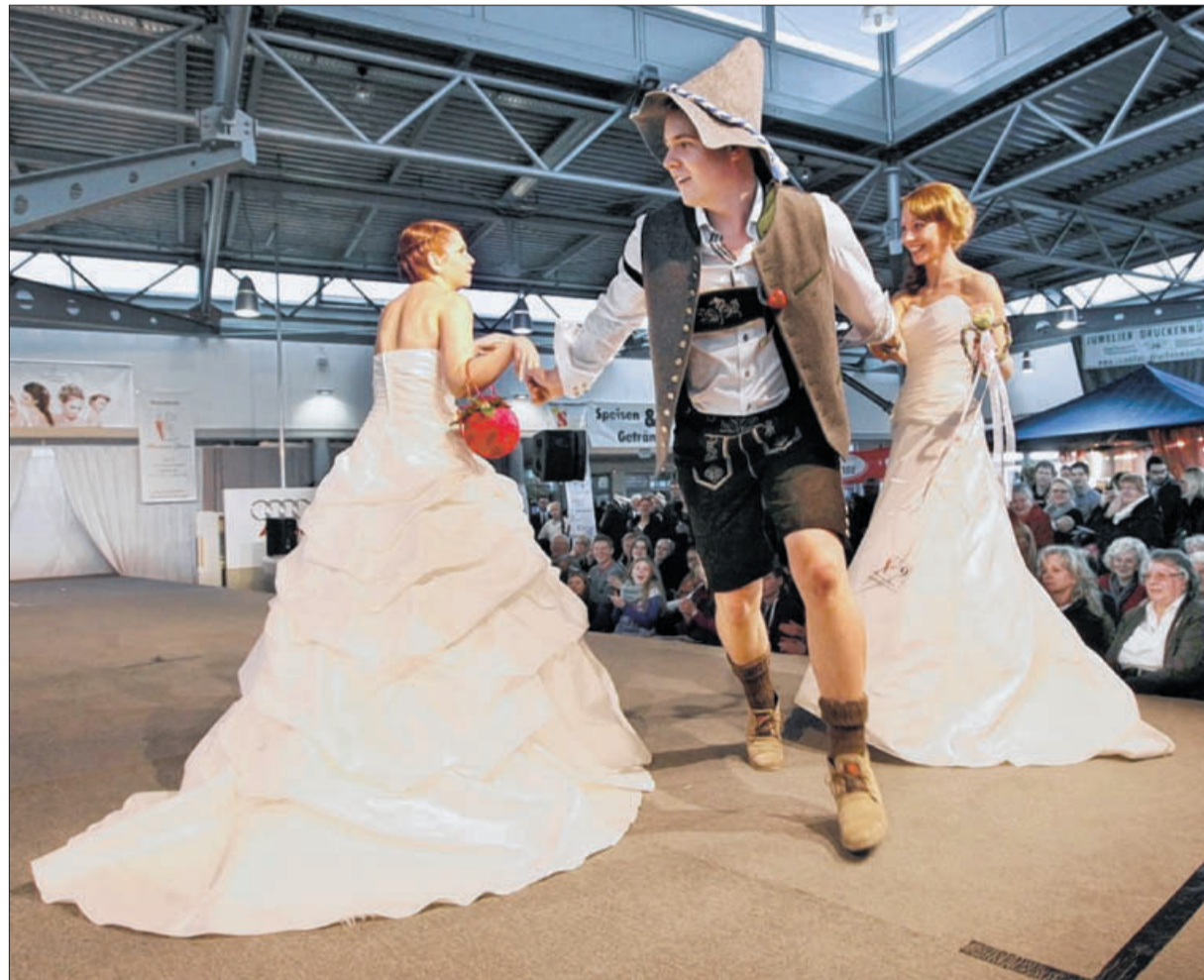
Neben feinem Stoff kommen bei der Modenschau zur Haller Hochzeit auch Trachten zum Einsatz – hier mit einem flotten Tanz auf dem Laufsteg. ■ Weitere Fotos in der Bildergalerie auf www.hallertagblatt.de

Haller Hochzeit im Autohaus Schümann – Hunderte Besucher bei Modenschauen